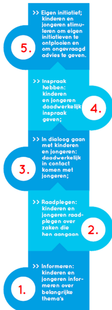
Afbeelding 6: Kinderparticipatieladder

De Kinderparticipatie cirkel/ladder staan centraal tijdens de Kinderrechtenvergaderingen en bij alle geplande acties. De Kinderrechtenambassadeurs denken mee en beslissen mee op gemeentelijk niveau en adviseert de gemeenteraad over belangrijke Rijswijkse zaken die kinderen aangaan. De Kinderrechtenambassadeurs evalueren het armoedebeleid en de beschreven acties in december 2017 en zullen de gemeenteraad adviseren over het armoedebeleid voor 2018.