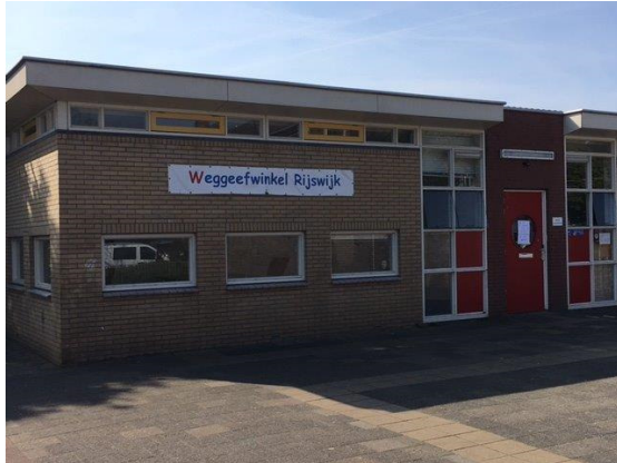
Afbeelding 3: de weggeefwinkel Rijswijk.