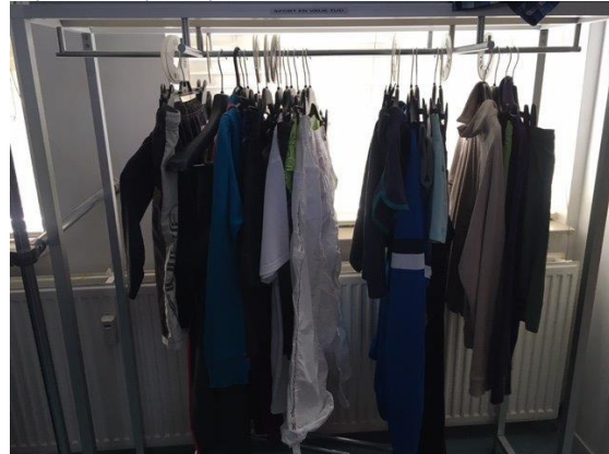
Afbeelding 4: kindersportkleding voor Rijswijk