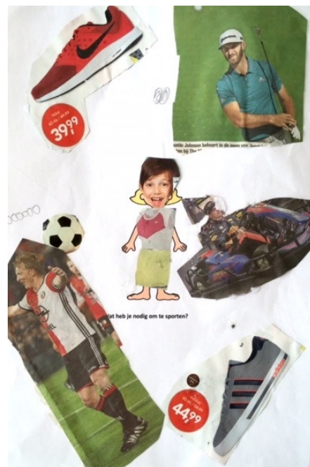
Afbeelding 1: collage 'meedoen' gemaakt door de Rijswijkse leerlingen van KinderrechtenNU-basisscholen.

* Armoede verwijst naar gezinnen die niet kunnen beschikken over hetgeen in de samenleving minimaal noodzakelijk is. Armoede van kinderen is gerelateerd aan het inkomen van een huishouden, omdat kinderen voor hun voorzieningen grotendeels afhankelijk zijn van hun ouders.